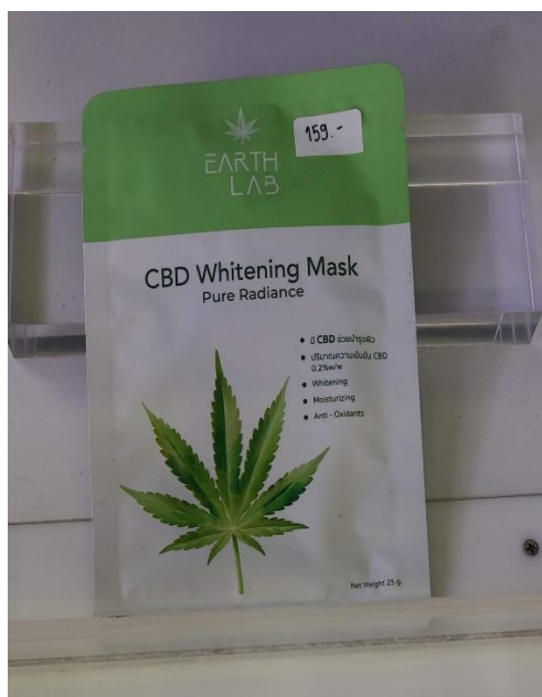
*帶有大麻元素的面膜

另外也有經營大麻商品販賣與製造的商家表示，大麻合法化對當地泰國人民其實並無帶來衝擊，一般會購買大麻或是相關商品的基本都是國外的遊客，在地民衆不太會購買大麻或是大麻製成品。該業主也表示會使用大麻的民衆一般都是原本已有在使用大麻的，大部分遊客則多是保持著嘗鮮的態度來嘗試大麻或是含有大麻元素的產品。