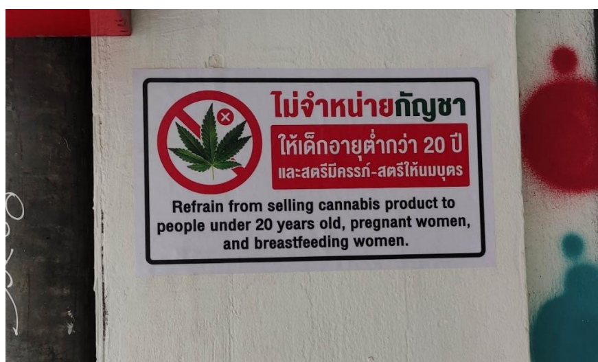
*購買大麻年齡限制的警示標語

「目前我認為也許需要對法律進行一些修改...很多人想開店，但這對孩子來說不安全。是的，因為他們還不瞭解這些{大麻}...他們可以從外面的人那裡購買。這就是我們面臨的兒童問題。」（大麻經營業者 8）