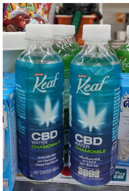
* CBD（大麻二酚）的洋甘菊飲料