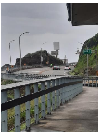
圖（二）：基隆沿海一帶