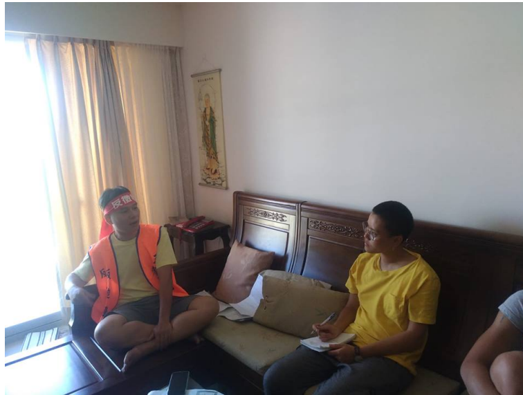
紀錄片第一集他家，已經被徵收了二遍拍攝紀錄

影片請見： https://www.facebook.com/LongpuAntiEviction/videos/254745131915062/ 共獲得49次分享，5600次以上觀看。（截至2018年十月八日）