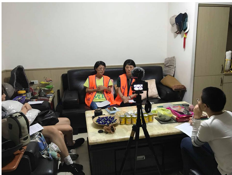
紀錄片第二集陳家姐妹花拍攝紀錄