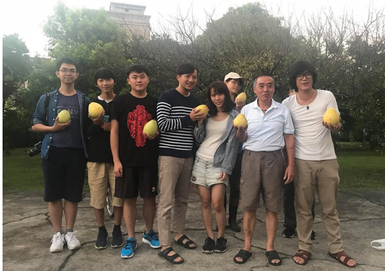
龍埔巡禮至里民家採柚子