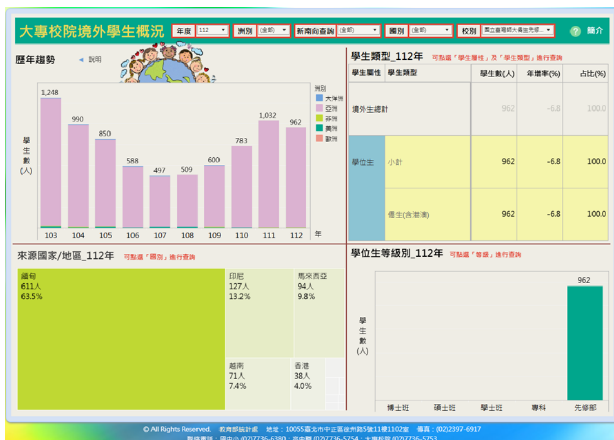
圖一: 大專院校境外學生概況112年國立臺灣師大僑生先修部

根據教育部統計處大專院校境外生概況統計圖顯示，112年全球來台境外生中以亞洲人為大宗，人數以越南(23.7%)、印尼(14.4%)、馬來西亞(9.0%)、日本(7.3%)、香港(7.9%)、泰國(5.3%)，南韓、印度、緬甸，由大到小排序。圖一呈現臺師大僑生先修部的境外生以緬甸人佔六成四為最高；圖二顯示臺北大學境外生佔比前五名由大到小為馬來西亞(22.1%)、香港(20.4%)、緬甸(16.4%)、印尼(9.7%)、越南(7.6%)。