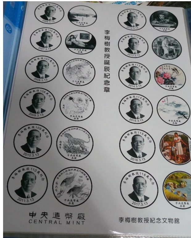
圖 5. 2006 年，中央造幣廠製作的李梅樹紀念銅章設計圖