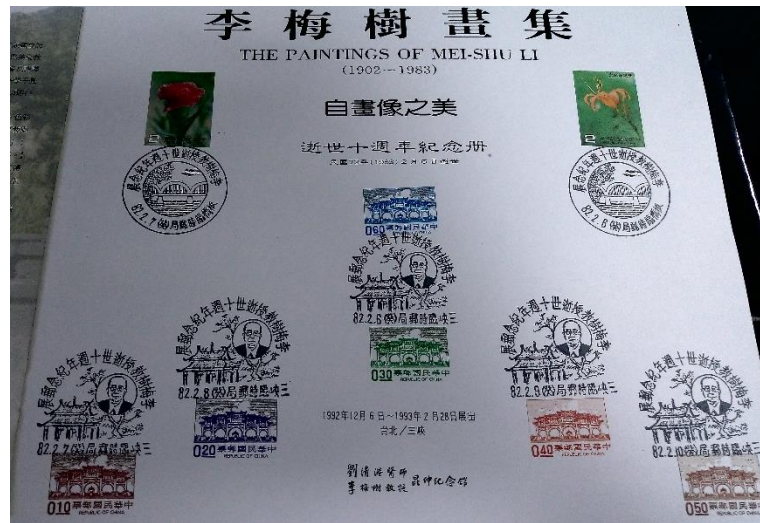
圖 4. 1993 年李梅樹逝世十週年紀念郵戳

相較於其他私人美術館，李梅樹紀念館以郵戳為主題的紀念活動幾乎是前所未見的，雖然民間團體皆可申請臨時郵局，但必須經過郵政機關的審核，要有一定程度的知名度或社會貢獻才會許可，而且以李梅樹的人物肖像製作的紀念郵戳，在解嚴初期的臺灣社會是相當罕見的。創館長 A 希望透過這樣子的作法去紀念李梅樹為社會鞠躬盡瘁的精神，除了申請郵戳外，他更透過管道向發行國家硬幣的中央造幣廠申請鑄造「李梅樹教授誕辰紀念銅章」，自 2006 年起發行至 2017 年，共十枚，正面為李梅樹的肖像，背面是他的繪畫作品及祖師廟的意象。中央造幣廠開會討論後通過館方申請，認為「李梅樹教授以堅貞的意志致力於民間藝術的發揚，在第三次重建三峽祖師廟上注入一生的心血，使該廟獲得中外學者及專家給予『東方藝術殿堂』的美譽。 29 」李梅樹的形象橫跨國族認同變遷的年代，先後被不同視角的行動者詮釋頌揚，對照在當時所留下的文本和資料裡。李梅樹在世時的從政背景，和他重建祖師廟運用的中華文化典故，受到早期政府讚揚推廣。當他過世後，國家文化想像的轉變，政府對李梅樹的解讀逐漸轉向保留傳統技藝的鄉土寫實大師，使當時家屬的紀念活動獲得國家文化治理認可。政府機關運用各式紀念載體形塑李梅樹的意象，雖然這些很多都是館方主動申請促成的，但政府的審核，給予李梅樹文化正當性，進而影響日後教科書、口述導覽和地方政府參與等多元記憶形式的形成。