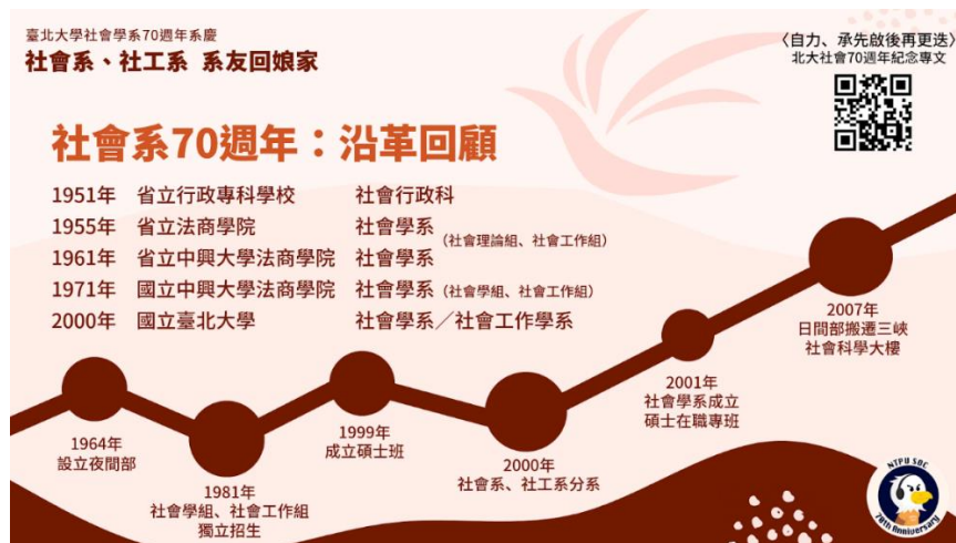
▲圖 6：社會學系歷史沿革（70 周年系慶版）