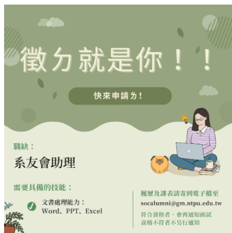
▲圖 4：助理徵才文宣 2