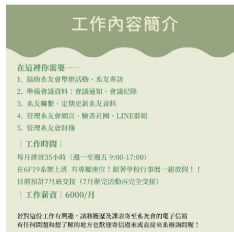
▲圖 5：助理徵才文宣 2

系友聯繫的部分，需定期更新系友通訊資料，於每年初固定寄送表單請系友更新通訊資料、舉辦活動時請系友通訊資料更新表或是舉辦系友流向調查問卷，並更新於系友會內部的系友資料庫及通訊錄資料。當系上邀請系友回來演講時，也會邀請系友接受系友專訪，由助理撰寫專欄文章，將系友豐富的人生經驗分享於系友會網站，供在校生及系友閱讀。