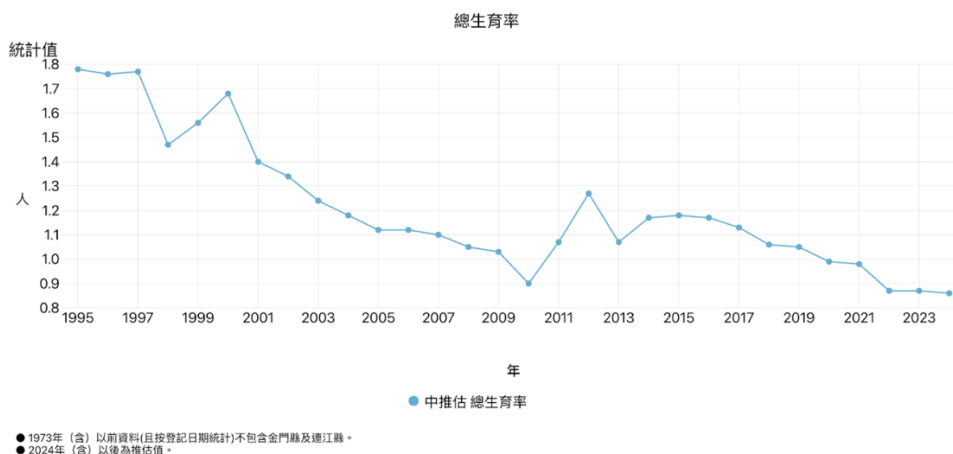
表二、台灣生育率成長