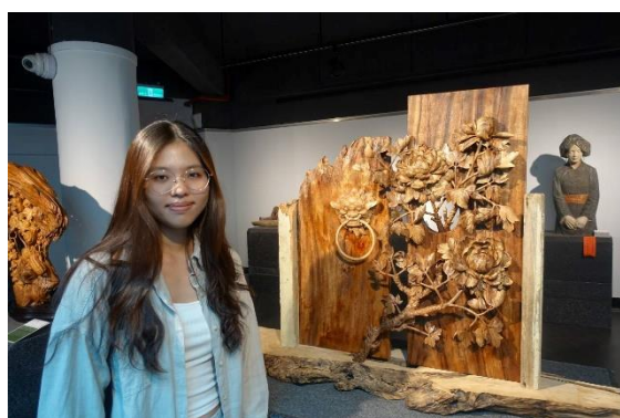
*左圖是我與木雕作品

參觀完博物館，我們沿著水美街（當地稱木雕街）走去附近的活動中心打算在那裡討論這兩天我們都看到什麼，沒想到，里長臨時起意帶我們走進民宅小巷，進入木雕師傅的家。師傅非常認真地迎接我們，還拿出了一堆價值不斐的木雕擺設，介紹的同時，還一邊說道：「有興趣的都來學，學個六個月，小隻的動物你也可以雕刻了。」沒多久，我們與師父道別，正式前往活動中心。