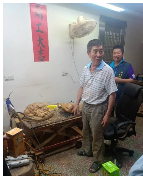
*右圖為木雕師傅介紹他的工作室