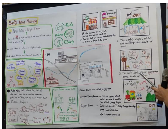
*上圖兩張是最終成果討論過程與成果