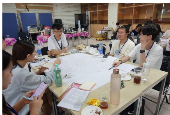
*右圖下為我們組討的論模樣