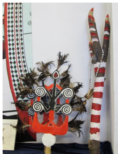
上圖為插在拼板舟船頭上的雞毛製裝飾品