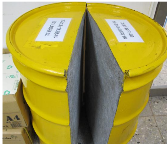
↑ 上圖為核廢儲存桶 (將核廢放入桶中，再灌入水泥)