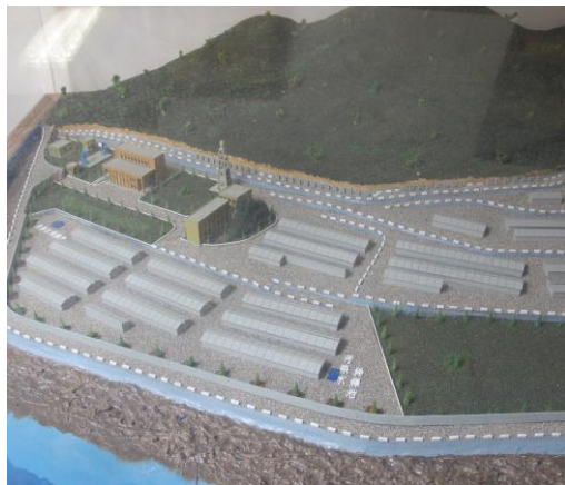
↑ 上圖為儲存場俯視模型

民國 71 年核廢儲存場正式設廠，民國 79 年台電接管。每年政府撥款兩千萬回饋金(至今累積超過兩億)，用於增加船班、修補道路、公車補助、防洪、垃圾場維護、醫療設備、電費補助、照明設備、獎助學金等。