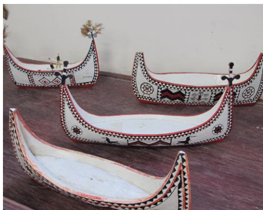
上圖為雅美族傳統拼板舟 右圖為雅美族傳統服飾

蘭恩文教基金會包含蘭恩幼稚園與蘭嶼文物館，其中蘭嶼文物館陳列許多雅美族的特色文物，以及說明飛魚 7 【註七】對於雅美族人的意義。